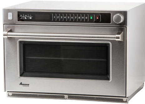
Se muestra el modelo AMSO35