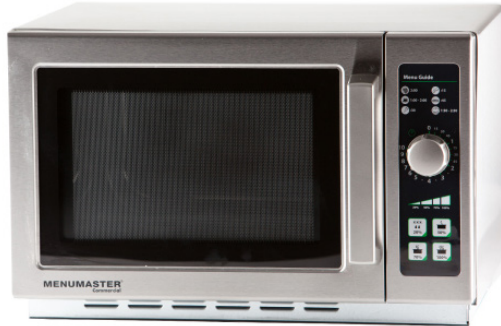
Se muestra modelo MCS10DSE