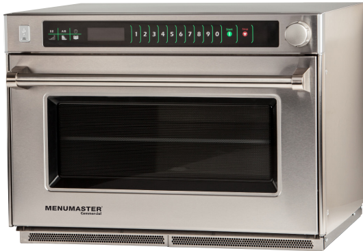
Se muestra el modelo MSO22