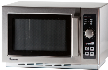
Se muestra modelo RCS10DSE