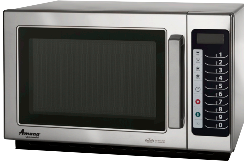
Se muestra modelo RCS10TS