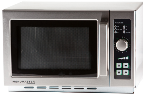
Modello RCS511DSE illustrato