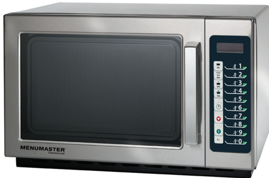
Modello RCS511TS illustrato